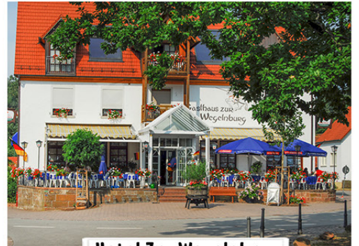
Hotel Zur Wegelnburg

Hauptstraße 15 D-76891 Nothweiler Tel. 0049 (0) 6394 920 9190 www.zur-wegelnburg.de