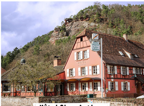
Hôtel Chez Anthon

40 rue Principale F- 67510 Obersteinbach Tel. 0033 (0) 388095501 www.restaurant-anthon.fr