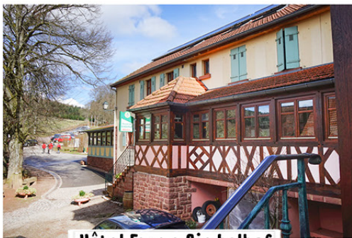
Hôtel Ferme Gimbelhof

F- 67510 Lembach Tel. 0033 (0) 388944358 www.gimbelhof.com