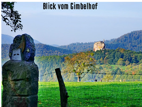
Blick vom Gimbelhof

12 Place de la République F-67160 Wissembourg Tel. 0033 (0) 388941400 www.couronne-wissembourg.com