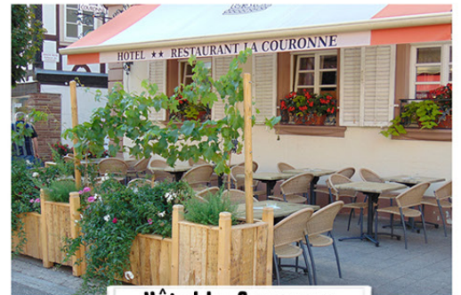
Hôtel La Couronne

F- 67510 Lembach Tel. 0033 (0) 388944358 www.gimbelhof.com