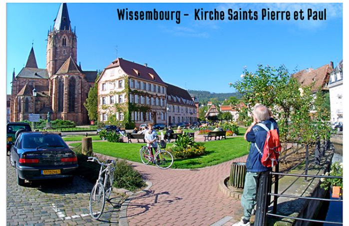
Wissembourg – Kirche Saints Pierre et Paul